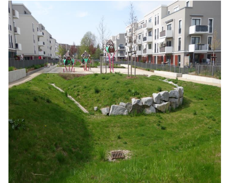
Retentionsmulden im Außenbereich der Häuser in der Kräutersiedlung Dresden-Gorbitz