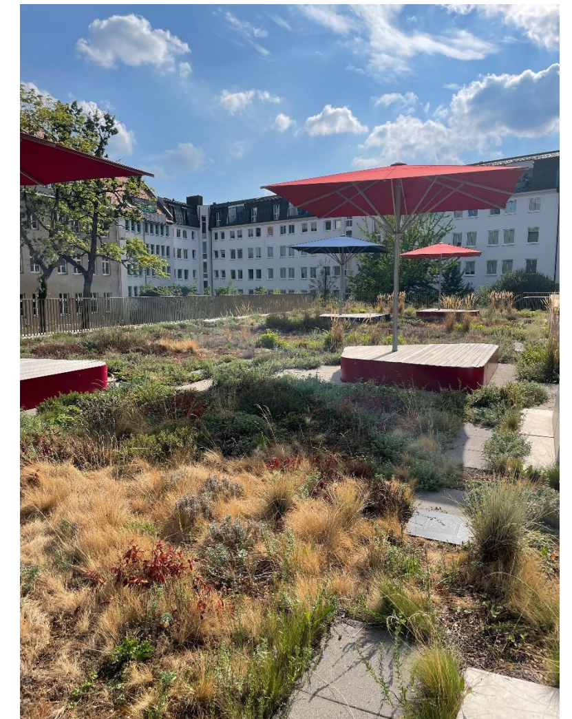
Regenwasserrückhalt im Stadtquartier Dresden-Neustadt Dachbegrünung Turnhalle Berufliches Schulzentrum für Wirtschaft „Prof. Dr. Zeigner“

Kosten Regenwasserbewirtschaftung anhand von Szenarien (regenwasseragentur.berlin)