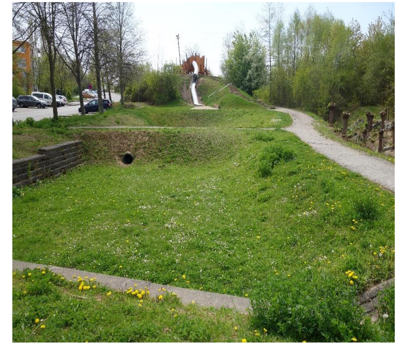
Naturspielraum Weidigtbach Kräutersiedlung Dresden-Gorbitz