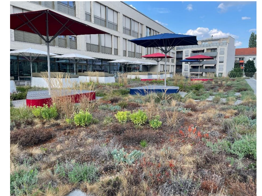
Regenwasserrückhalt im Stadtquartier Dresden-Neustadt Dachbegrünung Turnhalle Berufliches Schulzentrum für Wirtschaft „Prof. Dr. Zeigner“