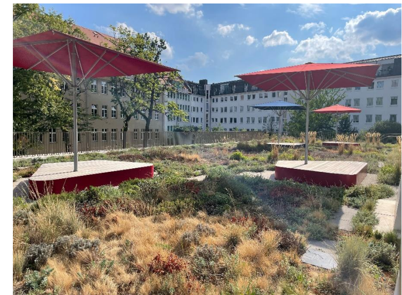
Regenwasserrückhalt im Stadtquartier Dresden-Neustadt Dachbegrünung Turnhalle Berufliches Schulzentrum für Wirtschaft „Prof. Dr. Zeigner“